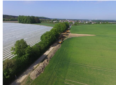
Rückhaltebecken mit Straßenquerung (Mühlhausen)