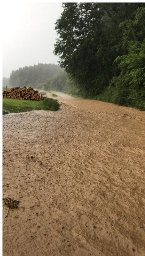
Starkregenabfluss Mallmersdorf