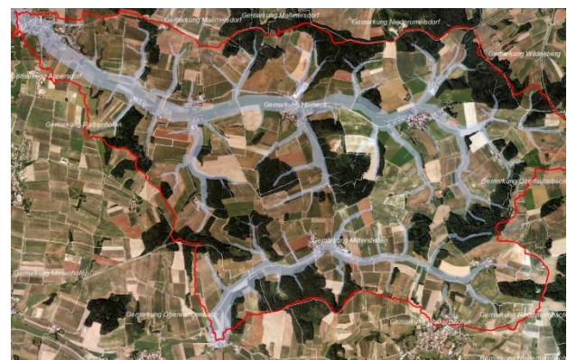
Fließwege Elsendorfer Bach

Meldung: https://bodenstaendig.eu/nachrichten/686/ein-radweg-hatte-seine-beste-zeit-hinter-sich