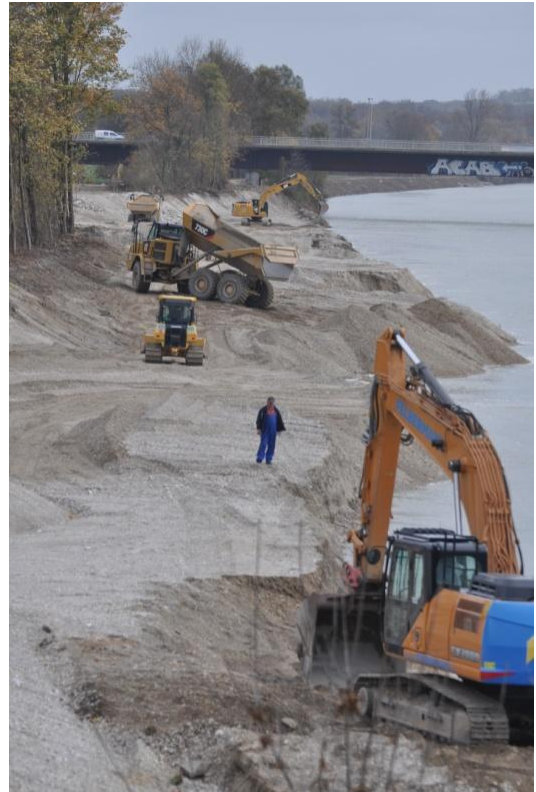
Isarrenaturierung Teilgebiet 2 Dingolfing (H&S: ARGE Projektmanagement)

EU-LIFE Projekt „Flusserlebnis Isar“: 7 Teilgebiete